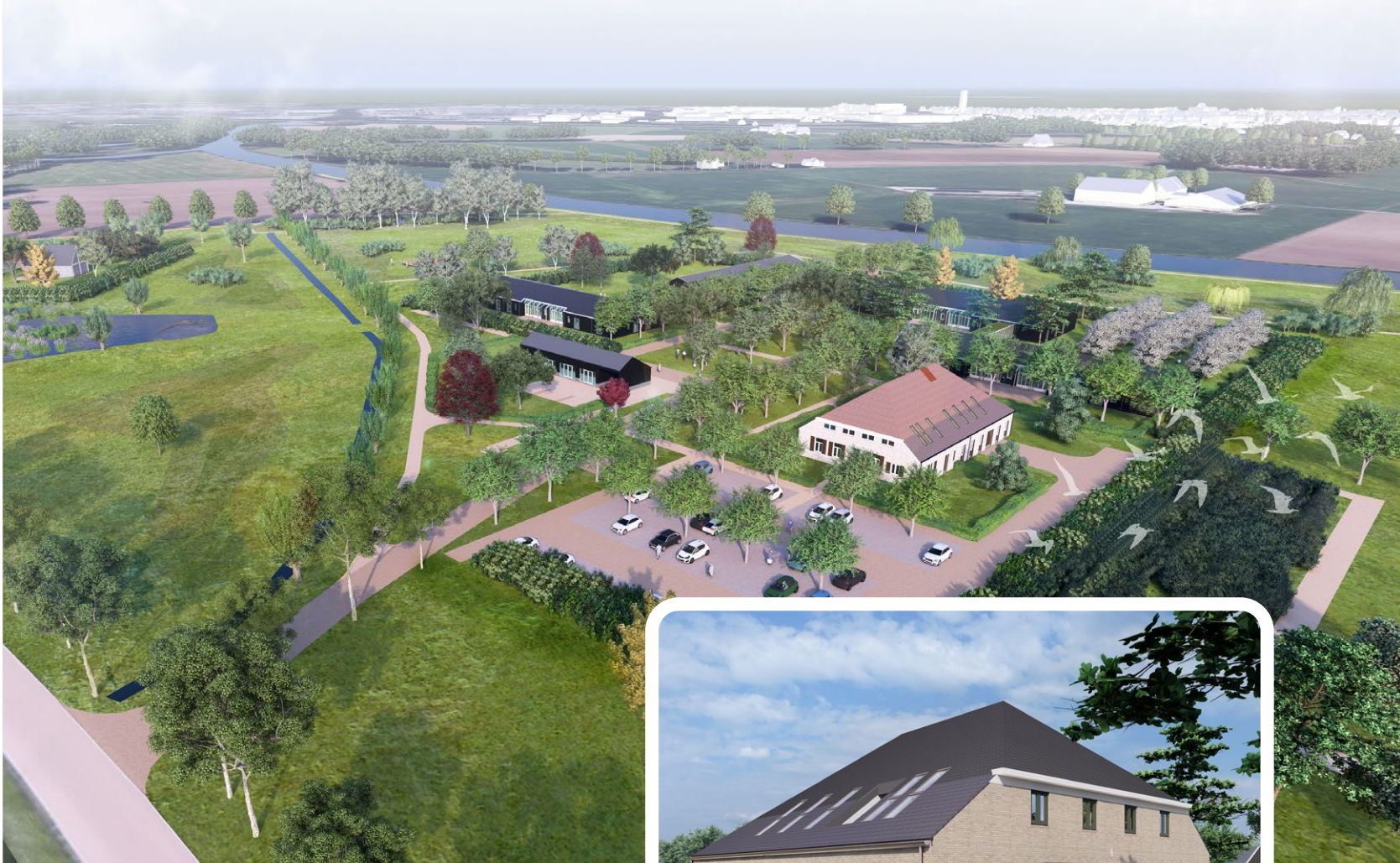
Zorgpark Warmse Water komt tussen Doetinchem en Terborg, vlakbij de Oude IJssel.

behorende dagbesteding en ondersteunende functies. Het gaat daarbij om mensen met een verstandelijke beperking en een intensieve begeleidingsvraag en cliënten met niet-aangeboren hersenletsel.