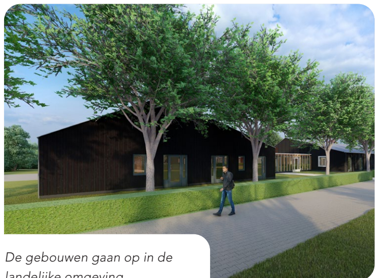
De gebouwen gaan op in de landelijke omgeving.

Met de komst van het nieuwe zorgpark verrijst er niet alleen een mooie, beschutte en rustgevende leefomgeving voor onze cliënten, maar ook een prettige werkplek voor onze medewerkers. We willen onze cliënten op Zorgpark Warmse Water bovendien zoveel mogelijk vaste gezichten bieden en toekomstige medewerkers meer lange diensten. Er is inmiddels een werkgroep gestart die zich bezig gaat houden met de personele invulling. Ook zijn we begonnen met de selectieprocedure voor de toekomstige bewoners van zorgerv Oost en Midden (foto bij dit kader). Begin 2025 krijgen de eerste cliënten en verwanten hierover duidelijkheid.