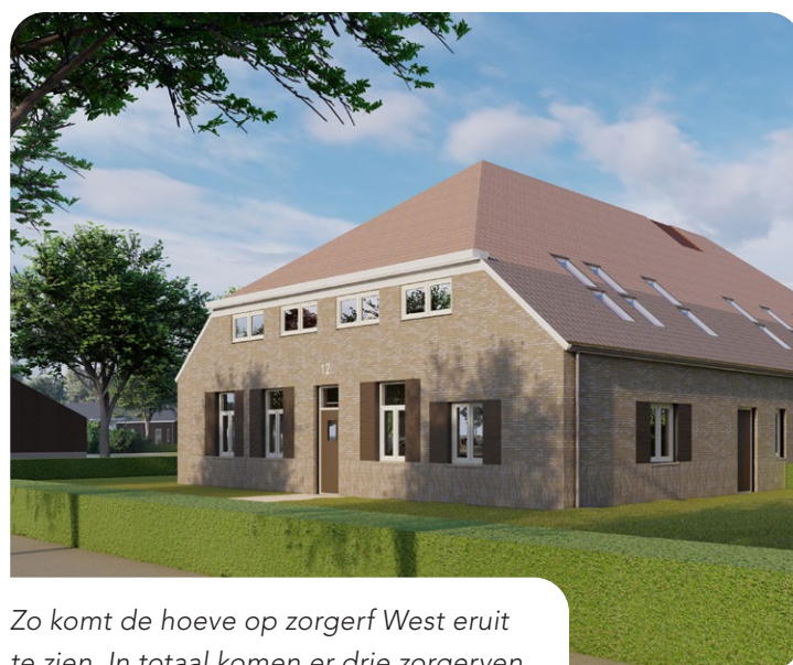
Zo komt de hoeve op zorgerv West eruit te zien. In totaal komen er drie zorgerven.

In de zorgerven komen woonplekken, logeerplekken en dagbestedingsplekken. In totaal biedt het zorgpark straks plek aan maximaal 112 cliënten om te wonen en de daarbij